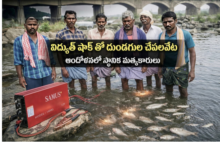
విద్యుత్ షాక్ తో దుండగుల చేపల వేట ఆందోళనలో స్థానిక మత్స్యకారులు నమోదు చేసే జరిమానాలు లేదా జైలుశిక్ష విధించే అవకాశముందని అధికారులు పలుమార్లు హెచ్చరించినప్పటికీ కొందరు వ్యక్తులు ఈ అక్రమ పద్ధతిని కొనసాగిస్తున్నారని వారు తెలిపారు. ఈ నేపథ్యంలో బేకుమట్ల, ఎండ్లపల్లి, రాయినగూడెం గ్రామాలకు చెందిన మత్స్యకారులు జిల్లా అధికారులు, పోలీసులు, మత్స్యశాఖ అధికారులు వెంటనే స్పందించాలని కోరుతున్నారు. మూసి వాగు ప్రాంతంలో అక్రమంగా బ్యాటరీలతో చేపలు పట్టుతున్న వారిని గుర్తించి వారి వద్ద ఉన్న బ్యాటరీలను స్వాధీనం చేసుకుని తగిన చర్యలు తీసుకోవాలని విజ్ఞప్తి చేస్తున్నారు. అలాగే అటువంటి వ్యక్తులకు కౌన్సిలింగ్ నిర్వహించి భవిష్యత్తులో ఈ విధమైన అక్రమ పద్ధతులకు పాల్పడకుండా చర్యలు తీసుకోవాలని కోరుతున్నారు. మత్స్య సంపదను రక్షించడం ప్రతి ఒక్కరి బాధ్యత అని, అక్రమంగా చేపలు పట్టడం వల్ల నష్టం వనరులు నాశనం కావడమే కాకుండా నిజమైన మత్స్యకారుల జీవనోపాధి కూడా ప్రమాదంలో పడుతుందని స్థానికులు చెబుతున్నారు. సంబంధిత అధికారులు వెంటనే చర్యలు తీసుకొని మూసి వాగులో చేపల సంరక్షణకు కట్టుదిట్టమైన చర్యలు చేపట్టాలని స్థానిక మత్స్యకారులు విజ్ఞప్తి చేస్తున్నారు.

సూర్యపేట మండలం బేకుమట్ల గ్రామ పరిధిలో ప్రవహిస్తున్న మూసి వాగులో కొందరు వ్యక్తులు అక్రమంగా బ్యాటరీల సహాయంతో విద్యుత్ షాక్ ఇచ్చి చేపలను పట్టుతున్న ఘటన స్థానిక మత్స్యకారుల్లో తీవ్ర ఆందోళన కలిగిస్తోంది. బేకుమట్ల, రాయినగూడెం గ్రామాలతో పాటు పరిసర ప్రాంతాలకు చెందిన కొందరు వ్యక్తులు మూసి వాగులోని పాలు చెక్ డ్యామ్ ల వద్ద నిల్వ ఉన్న నీటిలో బ్యాటరీలను ఉపయోగించి కరోంట్ ప్రవహింపజేసి చేపలను పడుతున్నారు. ఈ విధంగా విద్యుత్ షాక్ ద్వారా చేపలను పట్టడం వల్ల పెద్ద చేపలతో పాటు చిన్న చేపలు, చేపల గుడ్లు, ఇతర నీటిజీవులు కూడా నశించే ప్రమాదం ఉందని మత్స్యకారులు ఆవేదన వ్యక్తం చేస్తున్నారు. దీంతో భవిష్యత్తులో చేపల పెరుగుదల పూర్తిగా తగ్గిపోయే ప్రమాదం ఉందని స్థానిక జాలరులు తెలియజేస్తున్నారు. చెరువులు, వాగులు, నదులలో సహజంగా పెరిగే చేపల సంఖ్య తగ్గిపోతే, వాటిపై ఆధారపడి జీవనం సాగిస్తున్న నిజమైన మత్స్యకారులకు తీవ్ర ఆర్థిక నష్టం కలిగే అవకాశం ఉందని పేర్కొంటున్నారు. సంప్రదాయ పద్ధతుల్లో వలలు వేసి చేపలు పట్టే వారు రోజుల తరబడి కష్టపడాలి వస్తుంది. అయితే కొందరు వ్యక్తులు తక్కువ కాలంలో ఎక్కువ డబ్బులను సంపాదించడానికి బ్యాటరీలతో విద్యుత్ షాక్ ఇవ్వడం ద్వారా కొద్ది నిమిషాల్లోనే పెద్ద మొత్తంలో చేపలను పట్టిస్తున్నారు. ఈ విధానం వల్ల నీటిలో ఉన్న చిన్న చేపలు కూడా చనిపోవడంతో భవిష్యత్తులో చేపల వనరులు పూర్తిగా తగ్గిపోయిన వారు అంటున్నారు. ఆదేశవిధంగా విద్యుత్ ద్వారా చేపల వేట చేయడం చట్టపరంగా కూడా నేరంగా పరిగణించబడుతుందని మత్స్యకారులు గుర్తుచేస్తున్నారు. భారత మత్స్య సంపద సంరక్షణ చట్టాల ప్రకారం నీటిలో విద్యుత్ ప్రవహింపజేసి చేపలు పట్టడం నిషేధించబడింది. అలా చేసే వారిపై కేసులు