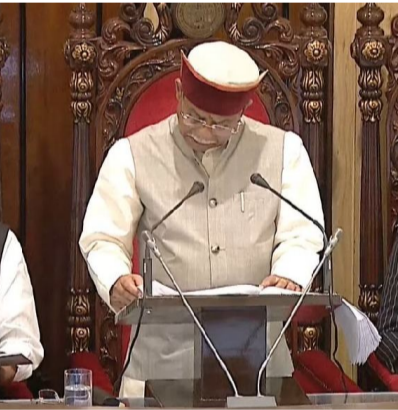
రూపొందించినట్లు తెలిపారు. రాష్ట్ర తలసరి ఆదాయం రూ.4.18 లక్షలకు చేరుకుందని

హైద్రా ద్వారా రూ.60 వేల కోట్ల ప్రభుత్వ ఆస్తులను కాపాడాలని తెలంగాణ రాష్ట్ర గవర్నర్ శివప్రతాప్ శుక్లా అన్నారు. తెలంగాణ అసెంబ్లీ బడ్జెట్ సమావేశాల ప్రారంభం సందర్భంగా ఉభయ సభలను ఉద్దేశించి ఆయన మాట్లాడారు. శ్రమించేతత్వం కలిగిన తెలంగాణ ప్రజలందరికీ శుభాకాంక్షలు అని ఆయన ప్రసంగాన్ని ప్రారంభించారు. ప్రజాకేంద్రీకృత పాలన ప్రభుత్వం విధానమని అన్నారు. విజన్ 2047 ద్వారా 3 ట్రిలియన్ డాలర్ల ఆర్థిక వ్యవస్థకు రోడ్ మ్యాప్