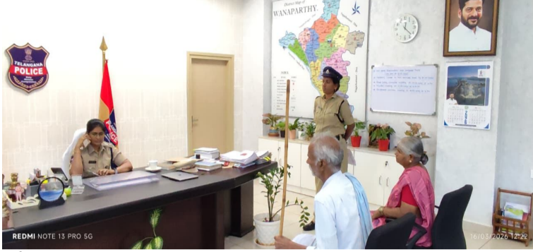
ఎస్సీ సంబంధిత అధికారులకు ఫోన్ ద్వారా ఫిర్యాదులను వెంటనే పరిష్కరించాలని ఆదేశించారు అందిన ఫిర్యాదుల్లో 02 - భూతగాదాల ఫ05 - ఇతర ఫిర్యాదులు వున్నాయి.