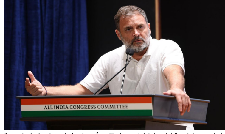
ప్రధానమంత్రి సంతరించుకుంది. కాన్ఫిరమ్ కు భారతరత్న ప్రకటించడం ఆయన దేశానికి చేసిన సేవలకు దక్కే నిజమైన గౌరవమని, ఆయనను సాధికారతకు చిహ్నంగా భావించే కోట్లాది మంది ఆకాంక్షలను నెరవేర్చినట్లు అవుతుందని రాహుల్ తన లేఖను ముగించారు. అయితే, రాహుల్ డిమాండ్ పై బీఎస్పీ అధినేత్రీ మాయావతి విమర్శలు గుప్పించారు. డాక్టర్ బీఆర్ అంబేద్కర్ వంటి దళిత బకానల్ గుర్తింపు విషయంలో కాంగ్రెస్ పార్టీ గత రికార్డును ఆమె ప్రశ్నించారు.

లోక్ సభ ప్రతిపక్ష నేత రాహుల్ గాంధీ, బహుజన సమాజ్ పార్టీ (బీఎస్పీ) వ్యవస్థాపకుడు, బహుజన నేత కాన్ఫిరమ్ కు మరణానంతరం భారతరత్న పురస్కారం ప్రధానం చేయాలని ప్రధాని సరేంద్ర మోదీని కోరారు. ఈ మేరకు ఆదివారం ఆయన ప్రధానికి ఓ లేఖ రాశారు. కాన్ఫిరమ్ జయంతిని పురస్కరించుకుని, ఆయన సేవలను స్మరించుకుంటూ ఈ విజ్ఞప్తి చేస్తున్నట్లు రాహుల్ తన లేఖలో పేర్కొన్నారు. భారత రాజకీయాల స్వరూపాన్నే కాన్ఫిరమ్ మార్చారని రాహుల్ కొనియాడారు. తన ఉద్యమాల ద్వారా బహుజనుల్లో, పేదల్లో రాజకీయ చైతన్యం నింపారని తెలిపారు. వారి ఓటు, గళం, ప్రాతినిధ్యం ఎంతో ముఖ్యమని గుర్తుచేశారని, ఈ దేశం అందరిదీ అని చాటిచెప్పారని వివరించారు. ఆయన కృషి వల్లే ఎందరో అణగారిన వర్గాల ప్రజలు రాజకీయాలను న్యాయం, సమానత్వం సాధించే మార్గంగా చూడటం ప్రారంభించారని పేర్కొన్నారు. ప్రతి భారతీయుడికి రాజ్యాంగం సమానత్వం, గౌరవం, భాగస్వామ్యం కల్పించిందని, ఆ హామీలను సమాజంలో అట్టుడుగున ఉన్నవారికి అందించేందుకు కాన్ఫిరమ్ తన జీవితాన్ని అంకితం చేశారని రాహుల్ గుర్తుచేశారు. ఇటీవల లక్నోలో జరిగిన 'సామాజిక పరివర్తన దినం' కార్యక్రమంలోనూ ఈ డిమాండ్ కు బలమైన మద్దతు లభించిందని ప్రధానికి రాసిన లేఖలో ప్రస్తావించారు. 2027లో యూపీ అసెంబ్లీ ఎన్నికలు జరగనున్న నేపథ్యంలో, కాంగ్రెస్ ఈ అంశాన్ని లేవనెత్తడం రాజకీయంగా