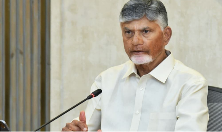
ఉద్ఘాటించారు. ఈ ఘటనపై పార్టీవరంగా కఠిన చర్యలు ఉంటాయనే సంకేతాలను ఇచ్చారు.